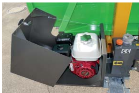
Der bewährte Honda Bezinmotor