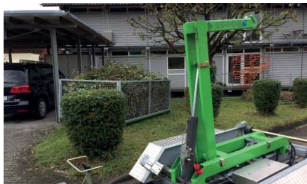
Lagern, ebenerdiges Be- und Entladen

Der AR 350 ist ein Multitalent für die täglichen Aufgaben im Handel, Handwerk und bei Kommunen.